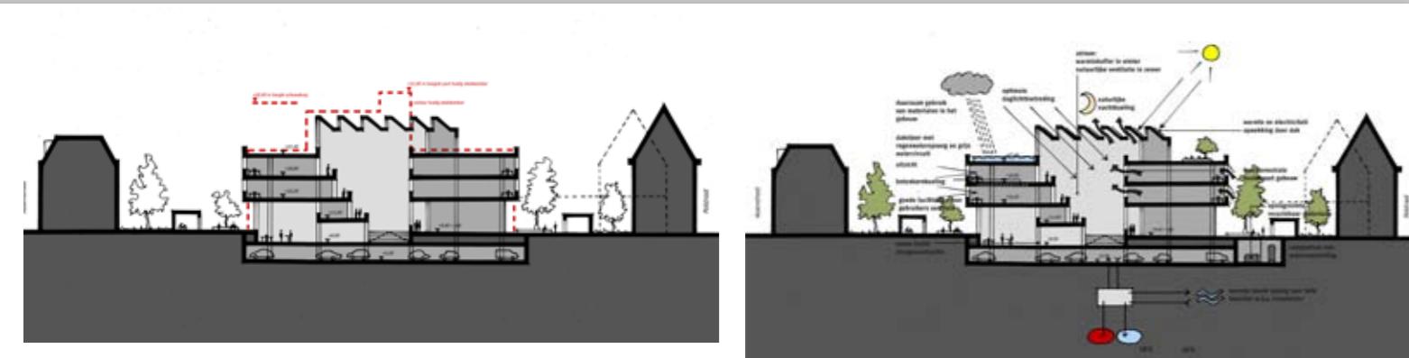
Laag en passend in de omgeving Deze schets laat zien dat de hoogte van het beoogde gebouw lager wordt dan het bestaande stadskantoor en de schouwburg.