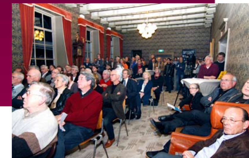
Driehonderd geïnteresseerden bezochten op 11 november de presentaties in het Stadhuis over vier grote binnenstadsprojecten - zoals hier in de Koffiekamer bij de presentatie van de haalbaarheidsstudie bibliotheek en film & theater.

tot voorstellen: huisvesting gemeentelijke organisatie, haalbaarheidsstudie van bibliotheek, film & theater en het bereikbaarheidsconclaaf. Het college van burgemeester en wethouders stelde de voorstellen op 23 november vast.